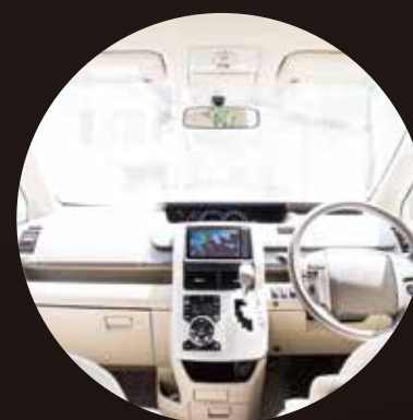
[ 自家用車/タクシー・トラックなどの 商用車の車内に ]