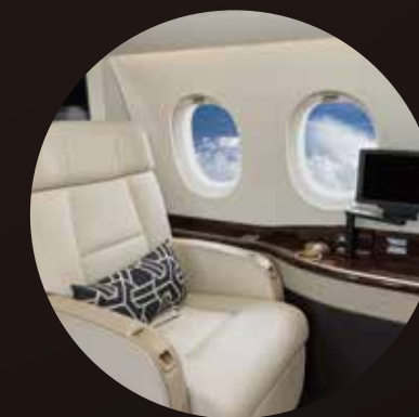
[ 飛行機/新幹線/バスのシート脇に ]