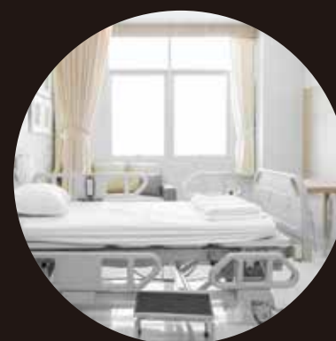
[ 病室/院内設備/寝室など ]