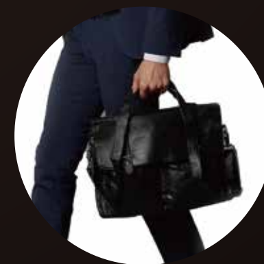
[ 持ち運び便利な超軽量モデル ]