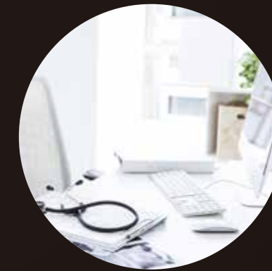
[ オフィス/家庭のデスクトップなど ]