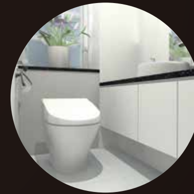
[ トイレ/化粧スペースなど ]