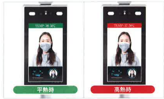
※画像は「NSAC-TH1001」製品の表示となります。

※体表面温度測定のための使用もできます ※表面温度分布を測定する機器ですが、体温計等の医療機器ではありません